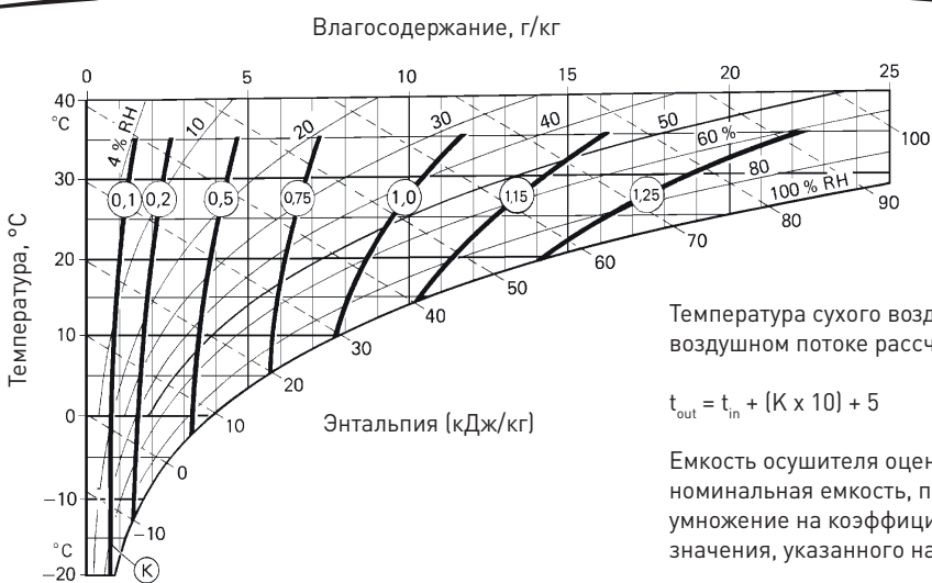
ДИАГРАММА КОРРЕКТИРОВКИ МОЩНОСТИ

Температура сухого воздуха при номинальном воздушном потоке рассчитывается по формуле: